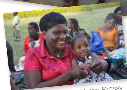
Destiny und Mutter Prossy