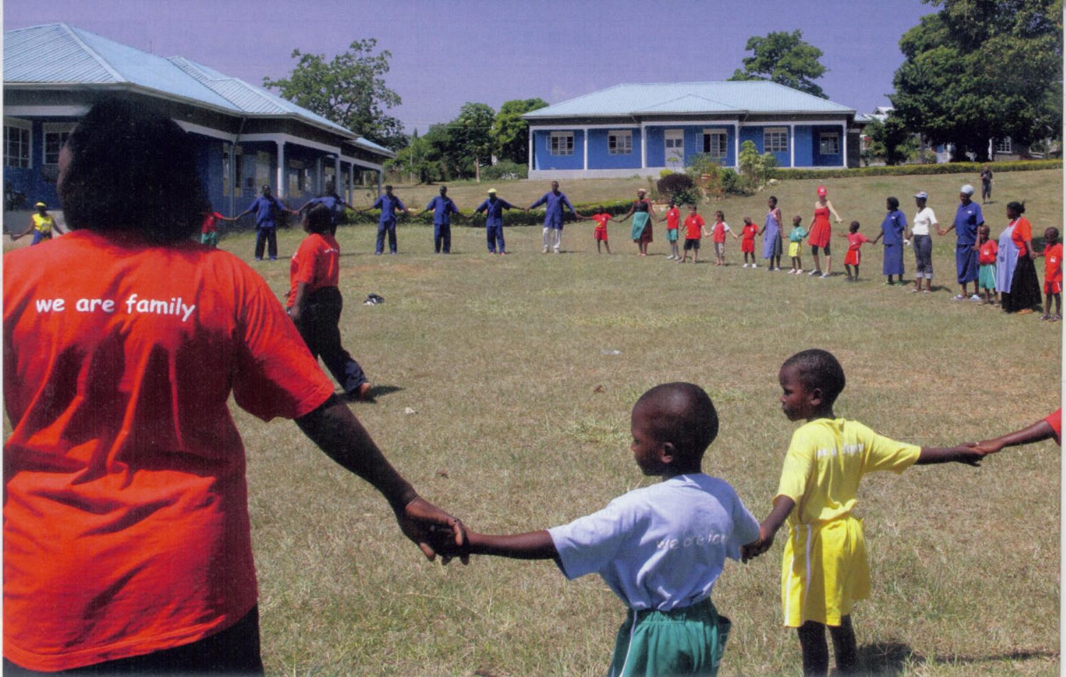
Sporttag bei den «Kids of Africa».