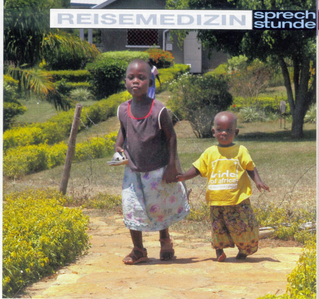
Zwei der Kinder, die hier ein Zuhause gefunden haben.